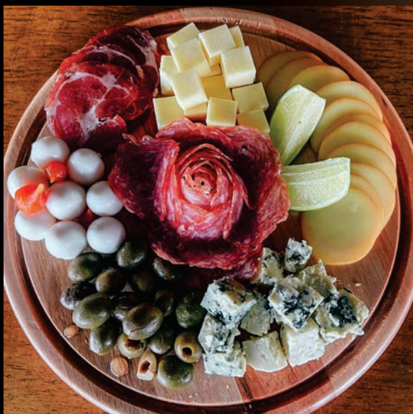
TÁBUA DE FRIOS

Isca de frango, potato skins e onion rings