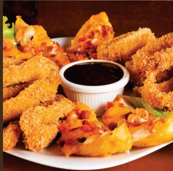
3 EM 1