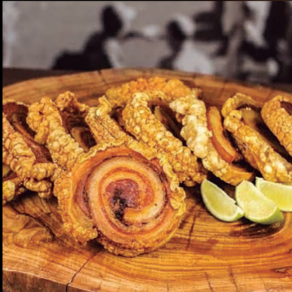
TORRESMO DE ROLO - 400g